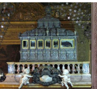
Tomba di san Francesco Saverio nella Basilica del Bom Jesus a Goa