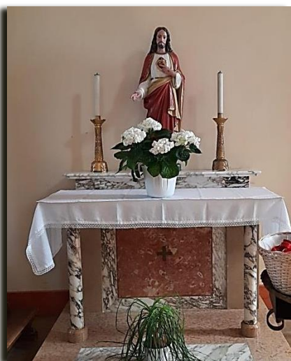
La statua del Sacro Cuore di Gesù nella sua nuova collocazione nella chiesa di Fossà. In alto: Sacro Cuore di Gesù e Cuore Immacolato di Maria nelle croci di dedicazione della Parrocchiale di Ceggia (XVII sec.).

L'espressione Cuore Immacolato è venuta in uso corrente a seguito del dogma della Immacolata Concezione , e soprattutto dopo le apparizioni della Vergine a Fatima , l'espressione è entrata nell'uso ecclesiale e liturgico.