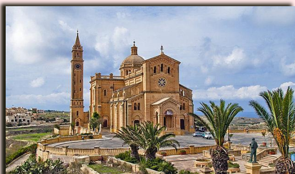
Il santuario della Madonna di Ta' Pinu. Sopra: il quadro della Vergine Maria assunta in Cielo, dipinto da Amadeo Bartolomeo Perugino nel 1619.

Nel 1920 si decise di costruire una nuova basilica che inglobasse al suo interno l'antica cappella e l'immagine miracolosa della Madonna Assunta in Cielo . Fu realizzata una grande chiesa in stile neo-romanico che fu consacrata nel 1932 . I pellegrini che si recano al santuario vi lasciano i loro ex-voto, preghiere, messaggi di speranza che tappezzano le pareti esterne della cappella.