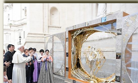
Papa Francesco benedice l'altare per il santuario di Namyang nel 2017

Così, un luogo di morte e di martirio oggi è stato trasformato in un'oasi di bellezza e di pace, dove un'intera comunità ha ritrovato il senso profondo della propria spiritualità.