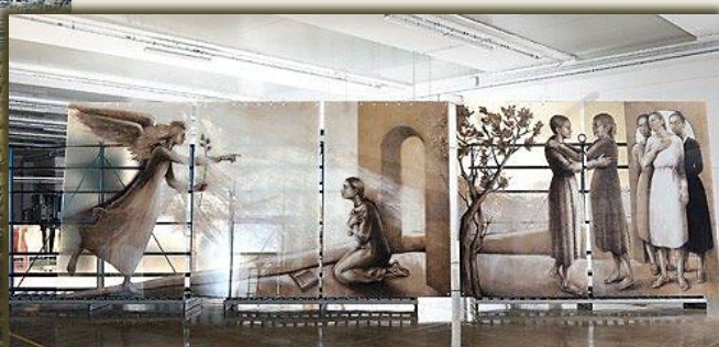
Santuario di Namyang, opera dell'architetto Mario Botta; vetrata dell'Annunciazione e della Visitazione di Giuliano Vangi per Namyang