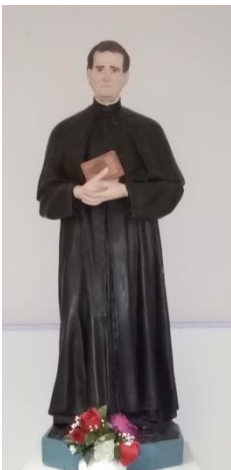
Statua di S. Giovanni Bosco nell'oratorio di Fossà