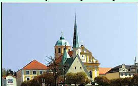
Il santuario della Madonna Nera di Altötting. A destra: La statua della Madonna col Bambino adornati con gli abiti preziosi. Sotto: la statua senza gli ornamenti.

Il santuario a pianta ottagonale originariamente era una cappella dove,